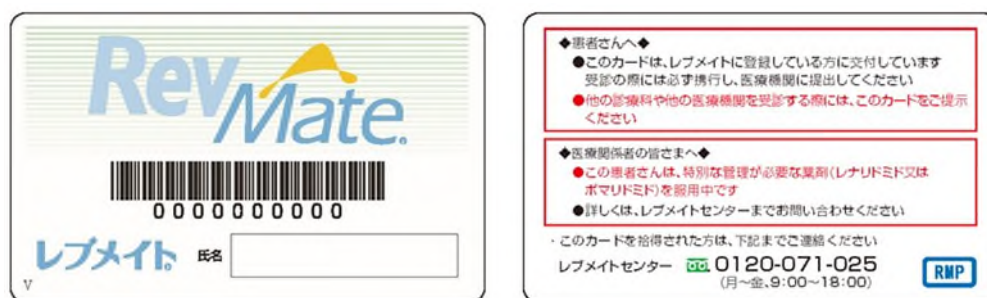
(患者登録カード：レブメイトカード)