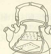
実母散 煎じつめて減少した部分