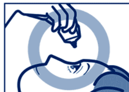
容器の先を下に向けて点眼