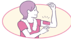
スポーツ後の 筋肉痛に