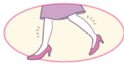
たくさん歩いた日の 足の筋肉疲労に