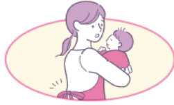
家事・育児などによる 肩こり・腰痛に