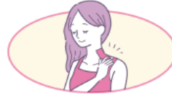
お肌に近い 弱酸性