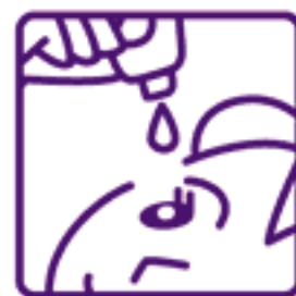
容器の先と目やまつ毛がふれることのないように