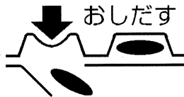
<PTPシートの取り出し図>