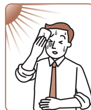
胃のもたれ、 胃部不快感