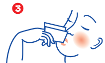
3 茶湯又は湯水を口に含み、服用してください。