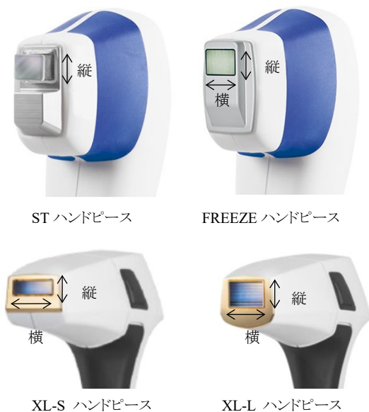
(図5)ハンドピースのレーザー出力部の縦・横の移動方向(代表例)