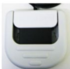
保護フラップを閉じた状態