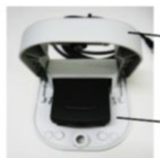
保護フラップを開いた状態