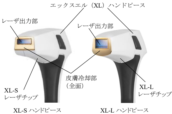
XL-S ハンドピース XL-L ハンドピース