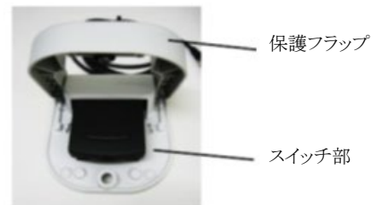
保護フラップを開いた状態