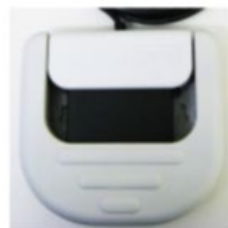
保護フラップを閉じた状態