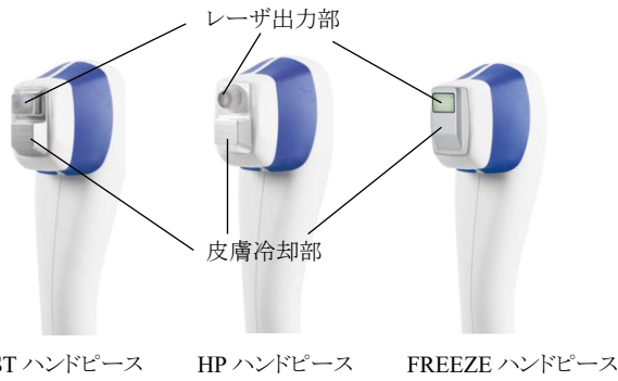
ST ハンドピース HP ハンドピース FREEZE ハンドピース