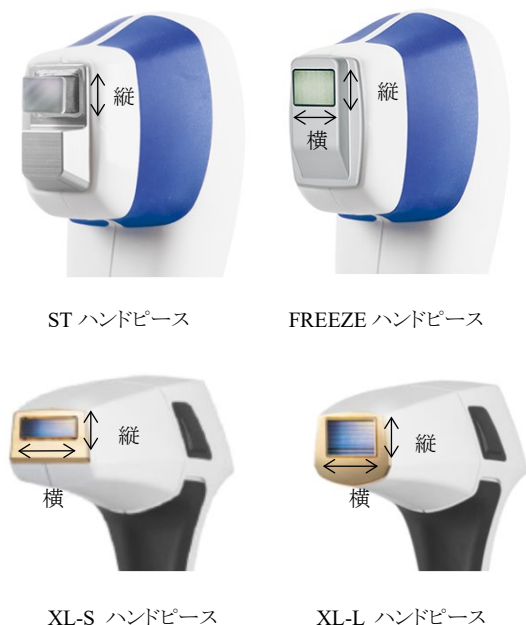
(図5)ハンドピースのレーザー出力部の縦・横の移動方向 (代表例)