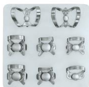
[クランプの形式] (左から) 9, 9 5, 203, 2A 56, 204, W2A