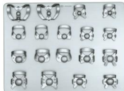
[クランプの形式] (左から) 210, 9, P-1, P-2 22, 27, 29, 208, 209 18, 138, 139, 7, 201, 202, 203, 204, 205