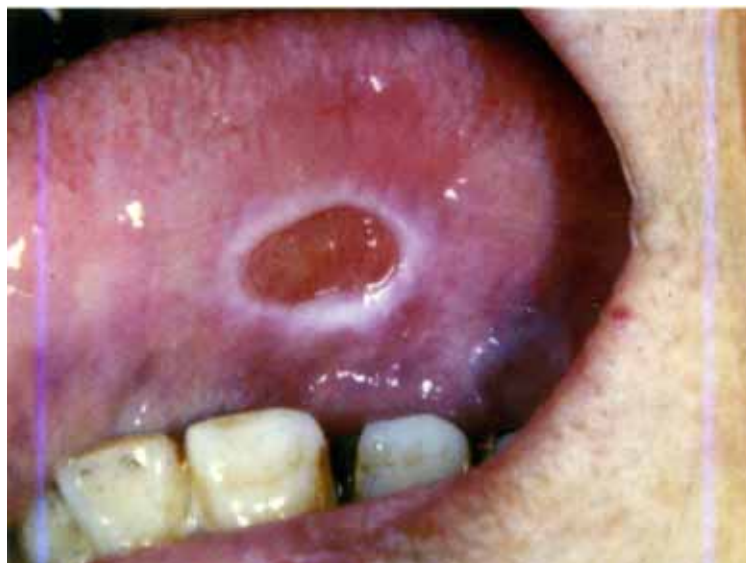
図3 ニコランジルによる難治性潰瘍

ニコランジルは狭心症治療薬として1984年より日本で使用されている薬剤であり、欧州各国では1994年より広く使用されている。1997年以降、フランス、イギリスを中心にニコランジル服用患者に発現する難治性口腔潰瘍が報告されている。日本においては数例の報告がある。