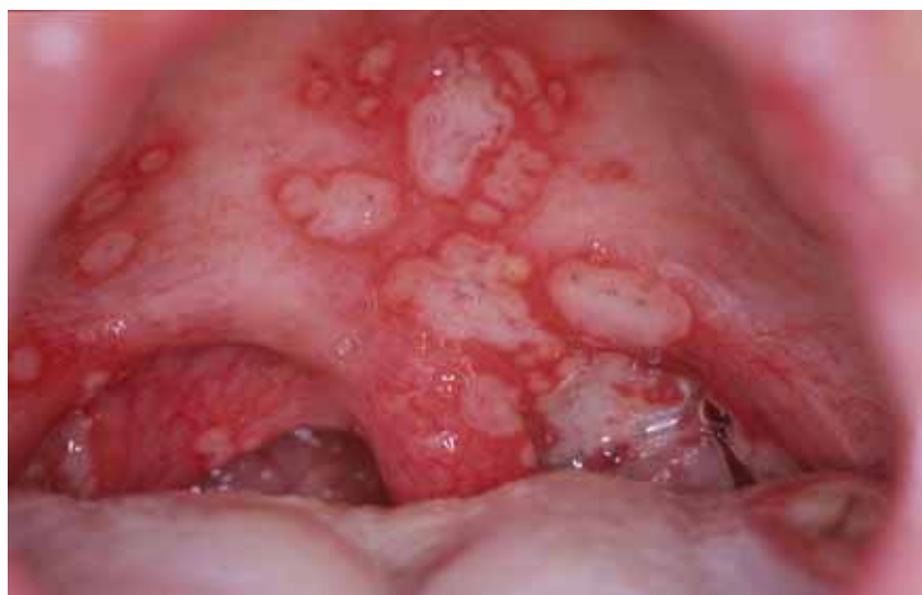
図2 ベーチェット病

皮膚症状もベーチェット病患者の90%の人にみられる。皮膚症状には、結節性紅斑、皮下の血栓性静脈炎、毛囊炎様皮疹、いわゆる座瘡様皮疹がある。治癒するが再発を繰り返す 8) 。