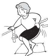
立ったり座ったり がつらい時