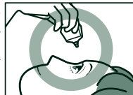
容器の先を下に向けて点眼