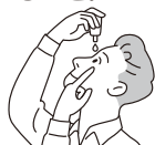
容器の先が目、まぶた、まつ毛にふれないように