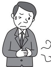
胃腸の調子が悪い