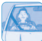
運転中の胃もたれ