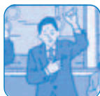
通勤途中のむかつき