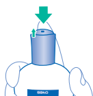
①容器上部のPRESSを押します。