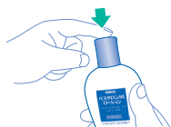
③終わりましたら容器上部を元に戻します。