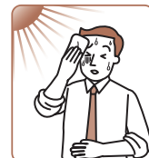
胃のもたれ、胃部不快感