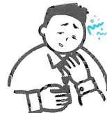
二日酔いのはきけ・むかつき