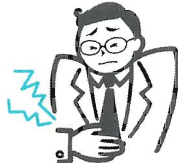
急に起きたつらい胃痛