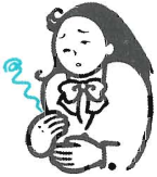
胃のむかつきや不快感

サクロンQは、胃酸やアルコールなどが胃粘膜を刺激して起きる「ムカムカ・はきけ・胃痛」に速く効く胃ぐすりです。成分（オキセサゼイン）が胃粘膜に直接作用し、つらい症状を改善します。