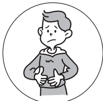
おなかの弱い方の 整腸に