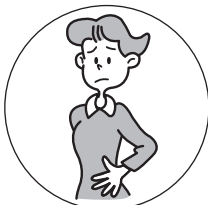
おなかが はったときに