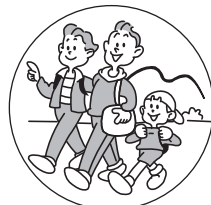
旅行など環境の変化で おなかの調子をくずしたときに