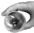
図 2. 容器の蓋を開ける