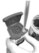
図 5. 液化済み検体を試薬カートリッジに添加する