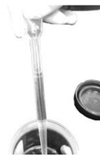
図 4. 検体をピペットの線まで (2mL 以上) 吸引する。