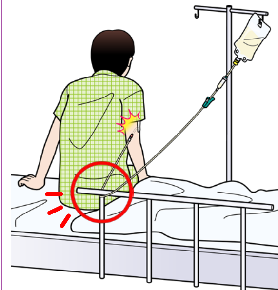
ベッド柵への引っかかり