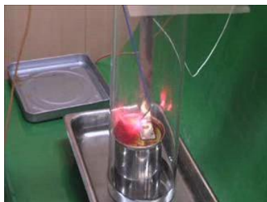
イソジンフィールド液10%