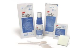
キャピロン 非アルコール性皮膚 スプレー キャピロン 非アルコール性皮膚 ワイブ (スリーエムヘルスケア(株))