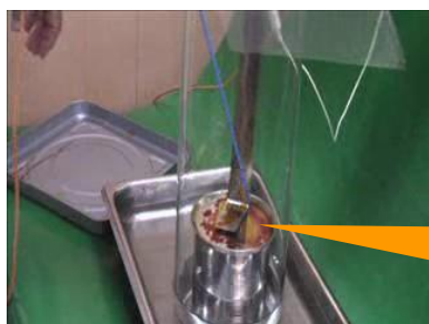
ボンゴール消毒液10%