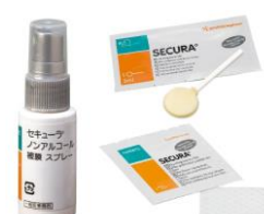
ノンアルコール スキンプレップ スプレー ノンアルコール スキンプレップ (スミス・アンド・ネフューウンドマネジメント(株))