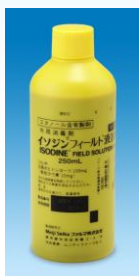
イソジンフィールド液10%