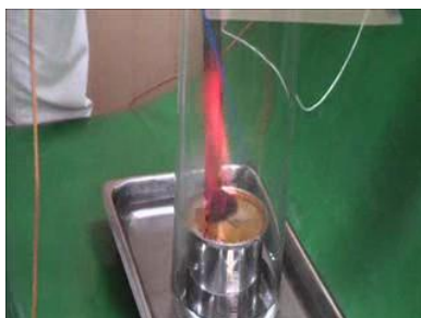
イソジンフィールド液10%