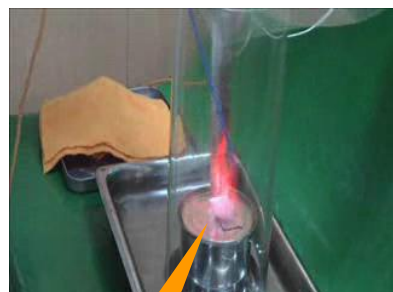
0.5%クロルヘキシジンエタノール溶液